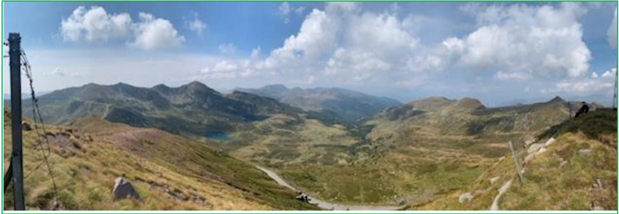
Fenomenaal uitzicht vanaf de Col di Crocette